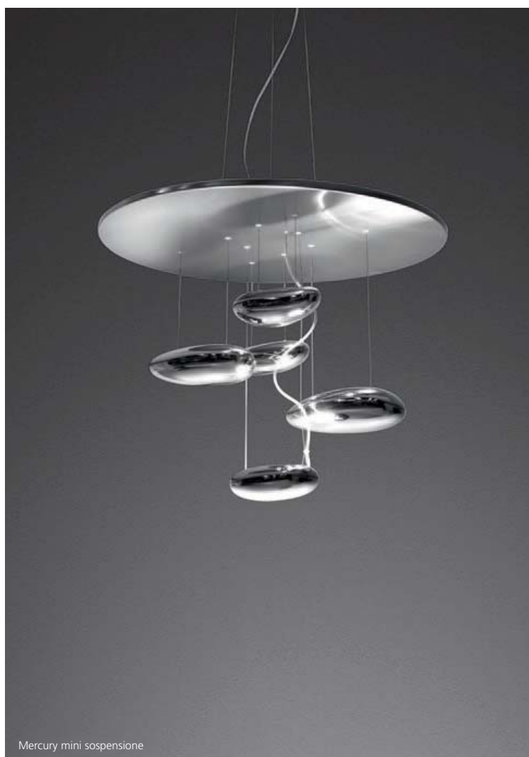
Mercury mini sospensione