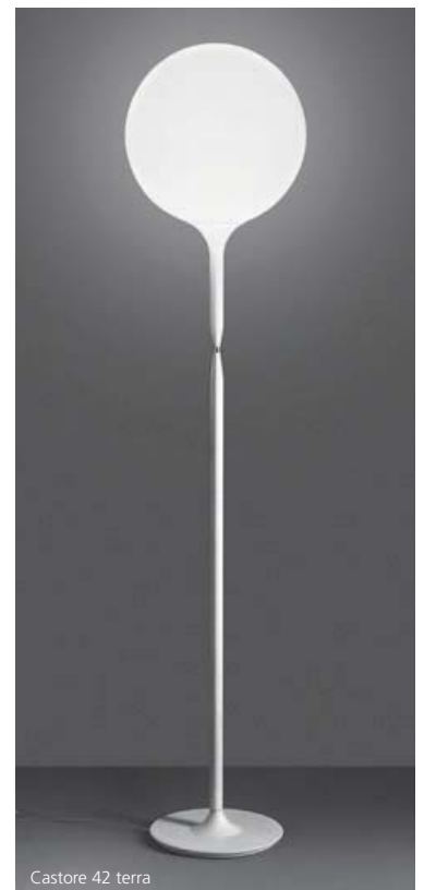
Castore 42 terra