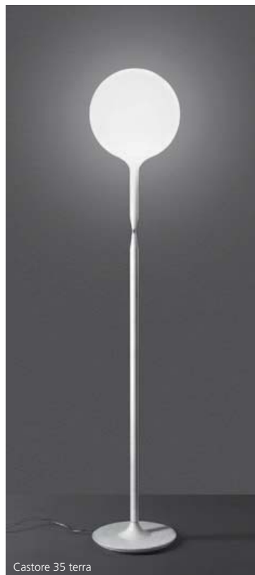
Castore 35 terra